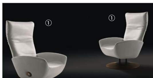
1 Magica 61500 aniline sense leather 9244 fin.11