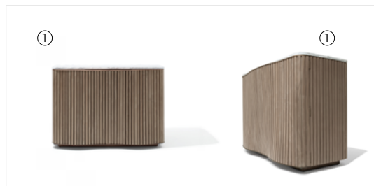
1 Kiri 86500 gold Calacatta marble top, leather 9111, fin. 2W