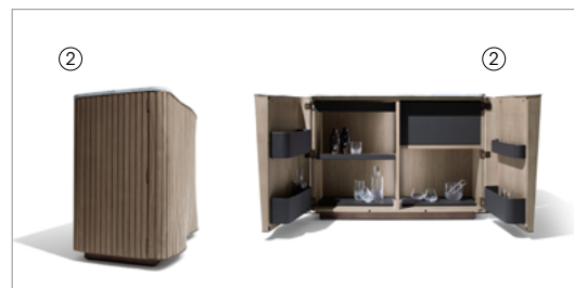
2 Kiri 86500 gold Calacatta marble top, leather 9111, fin. 2W